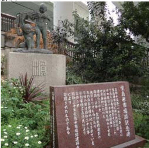
堂島米市場跡記念碑

堂島米会所は、" 世界最初に組織化されたデリバティブ取引所 " と社会的に認知されています。