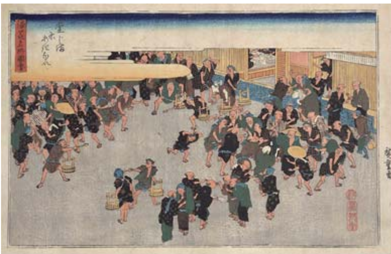
堂島米会所（大阪府立中之島図書館）